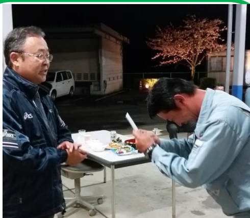
花見の席にて、社長より特別賞が送られました。